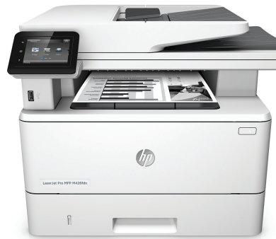
HP LaserJet Pro M426f -monitoimitulostin

Nopea tulostus-, skannaus-, kopiointi- ja faksauksuorituskyky sekä vankka ja kattava tietoturva työtapoihisi sopien. Tämä monitoimitulostin tulostaa tärkeät työt nopeammin ja suojaa tietokonetta uhkia vastaan. Alkuperäiset HP-värikasetit ja JetIntelligence tuottavat enemmän tulosteita. 2