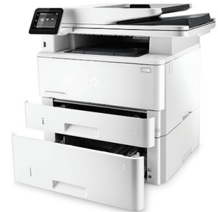
HP LaserJet Pro MFP M426fdw ja valinnainen 550 arkin paperilokero